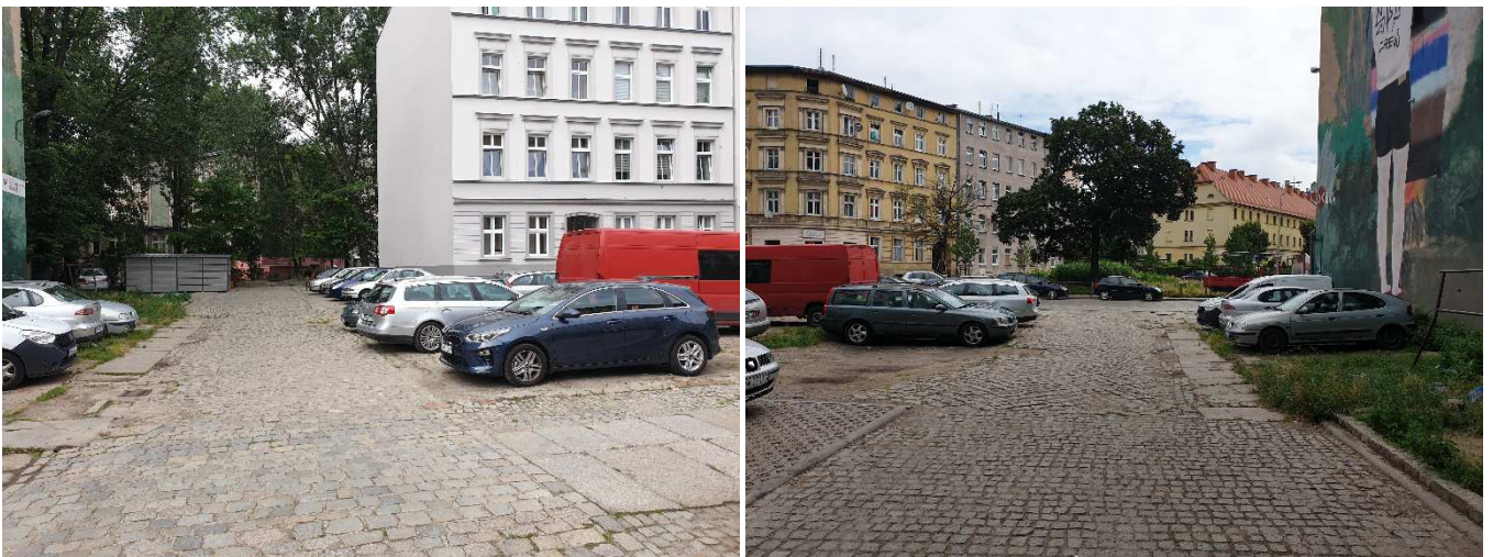
Zdjęcia przedmiotowej nieruchomości, położonej w obszarze osiedla Nadodrże przy ulicy Ołbińskiej 14A we Wrocławiu